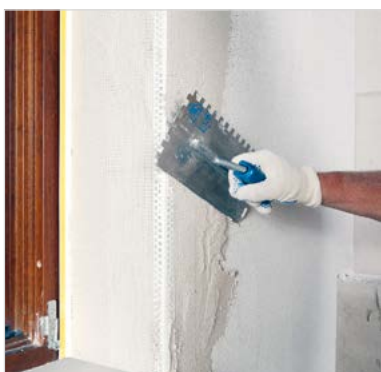
Instalace rohového profilu

Platný sortiment a expediční údaje viz aktuální ceník.