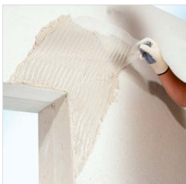
Provádění diagonální výztuže