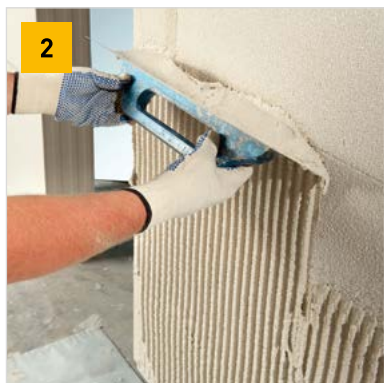
Nanášení první vrstvy Ytong vnější omítky tepelněizolační zubovou stěrkou se zubem 10 × 10 mm