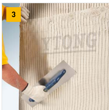
Vložení Ytong výztužné tkaniny