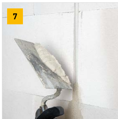
Aplikace vysprávkové malty