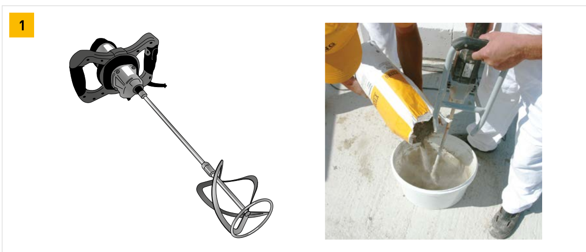
Vhodné stavební míchadlo

* pro vysrávkovou maltu NPD = nebylo stanoveno Platný sortiment a expediční údaje viz aktuální ceník.