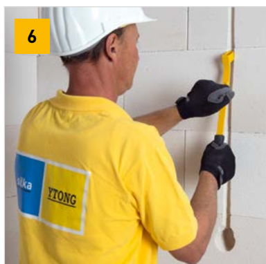
Vytvoření drážky pro elektroinstalaci a otvoru pro elektro krabici