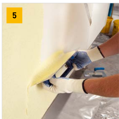
Nanášení finální vrstvy podle technologického předpisu výrobce