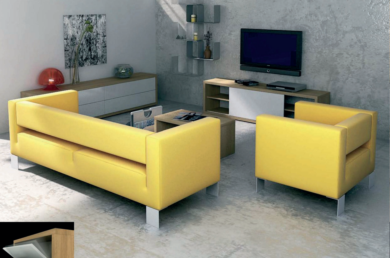
SKŘÍŇKY POLICOVÉ SE SKLOPNÝMI A POSUVNÝMI DVEŘMI CASES, SHELVES, HINGED AND SLIDING DOORS