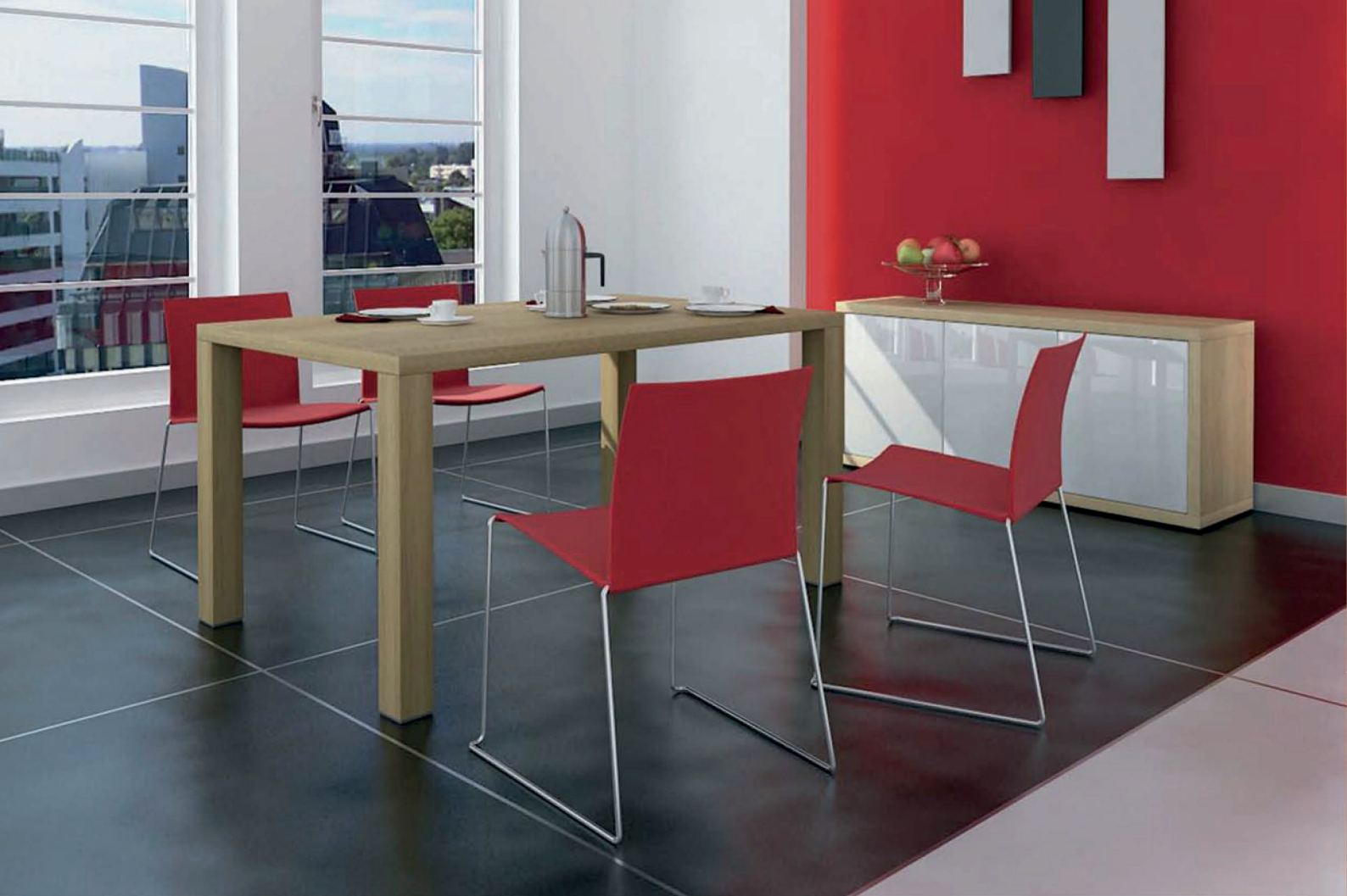
JÍDELNÍ A KONFERENCEČNÍ STOLY DINING AND COFFEE TABLES