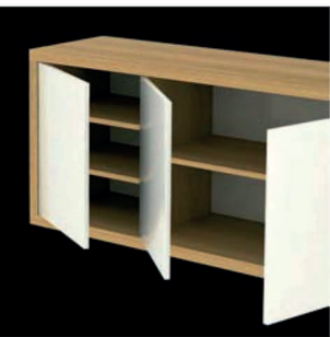
SKŘÍŇKY ZÁSUVKOVÉ, POLICOVÉ S DVEŘMI CASES, DRAWERS, SHELVES, DOORS